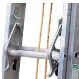
Sistema de bloqueo de peldaños

(Medidas en centímetros. Tolerancias en las medidas de ±1.5cm)