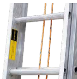
Peldaños de aluminio corrugado antideslizante