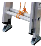
Zapatitas en caucho antideslizante.