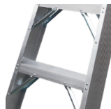
Escalones en aluminio corrugado

(Medidas en centímetros. Tolerancias en las medidas de \pm 1.5\text{cm} )