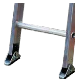
Zapatas en caucho antideslizante.