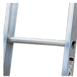
Peldaños tipo D en aluminio corrugado ergonómico

(Medidas en centímetros. Tolerancias en las medidas de \pm 1.5\text{cm} )