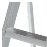
Escalones en aluminio corrugado con antideslizante