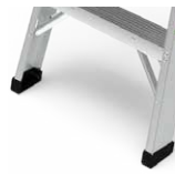
Zapatas en caucho antideslizante.