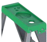
Bandeja porta herramientas